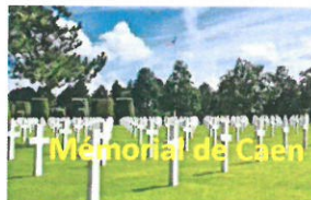
Memorial de Caen