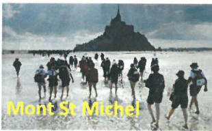
Mont St Michel